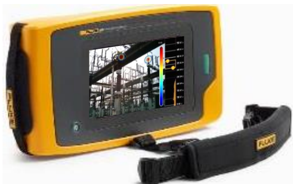
在可见光中准确定位局部放电位置